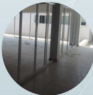
5.Cristalería y aluminio